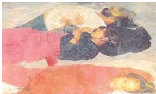
Congress butchers didn't spare Even Sikh women

The Sikhs, as we know, are a brave, patriotic community. They are the sword arm of India. They have watered the feet of Bharat Mata with their blood. Throughout this country's history, the Sikhs have risen against the Islamic barbarians, the British Christian savages. Thousands of Sikhs have become martyrs defending this holy land of ours. Yet, the Congress goons heartlessly butchered them. Even women and children were not spared. Those who have lived in Delhi through those horrific times, still recall witnessing scenes such as the Congress goons throwing tyres around the necks of sikhs and torching them alive.