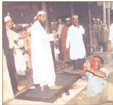
A Hindu victim pleading for his life