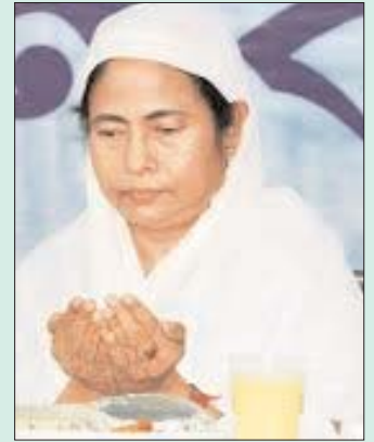
Mamata Didi offering ibadat

Okay let us admit for a moment that Modi was being obstinate in not accepting the skull cap. But let me ask, how many Muslims or Christians will allow a tilak to be applied to their foreheads? How many of them will accept prasadam offered to them? How many