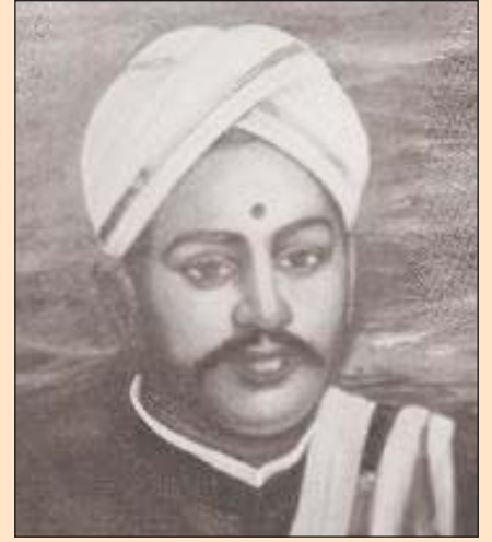
VO Chidambaran Pillai