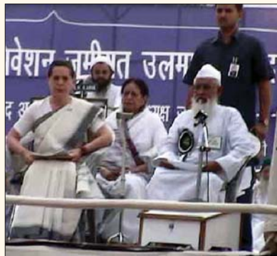
Saint Antonia Maino, aka Sonia Patron saint of minorities

On its face, it is difficult to read the Bill without seeing the blatant politicization by the National Advisory Council of the issue of protecting victims. Created to "interface with civil society" with a "special focus on disadvantaged groups," the National Advisory Council has failed miserably in carrying out its mandate by