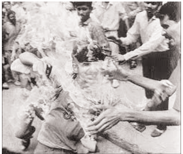
Congress goons burning alive a Sikh boy