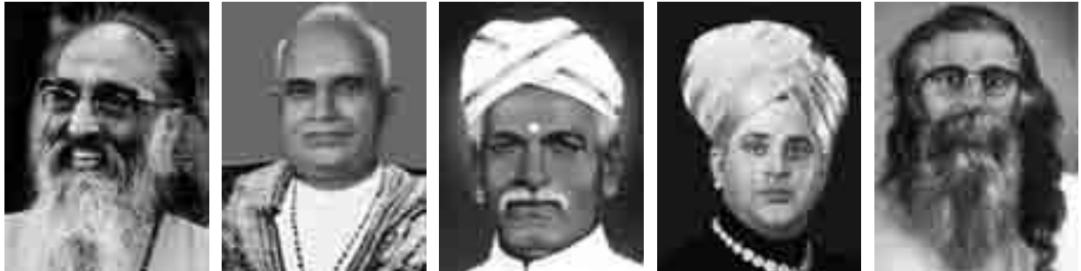
സ്വാമി ചിന്മയാനന്ദൻ മന്നത്തു പത്മനാഭൻ അയ്യങ്കാളി രാജാ ജയചാമ രാജവാഡിയാർ ഗുരുജി