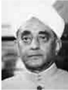
സി.പി. രാമസ്വാമി അയ്യർ